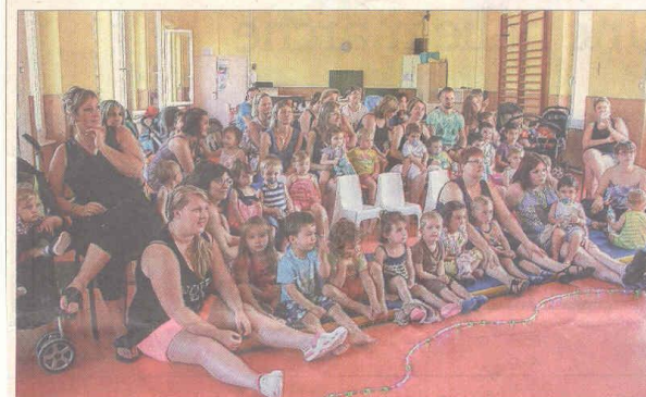
■ Un public qui a bien apprécié le spectacle.