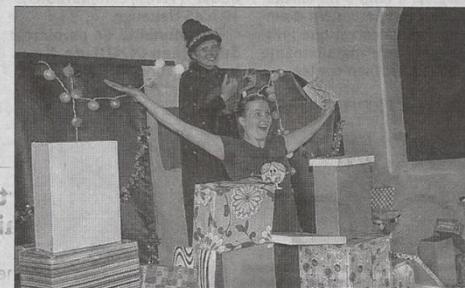
Derrière les paquets cadeaux, le spectateur devine et découvre les travers de la société de consommation.