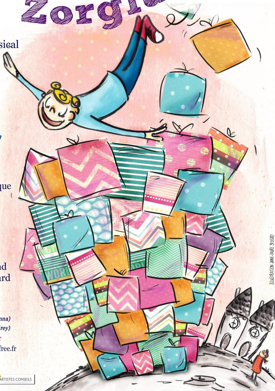
ILLUSTRATION ANNE-PAÏRE BRONIER