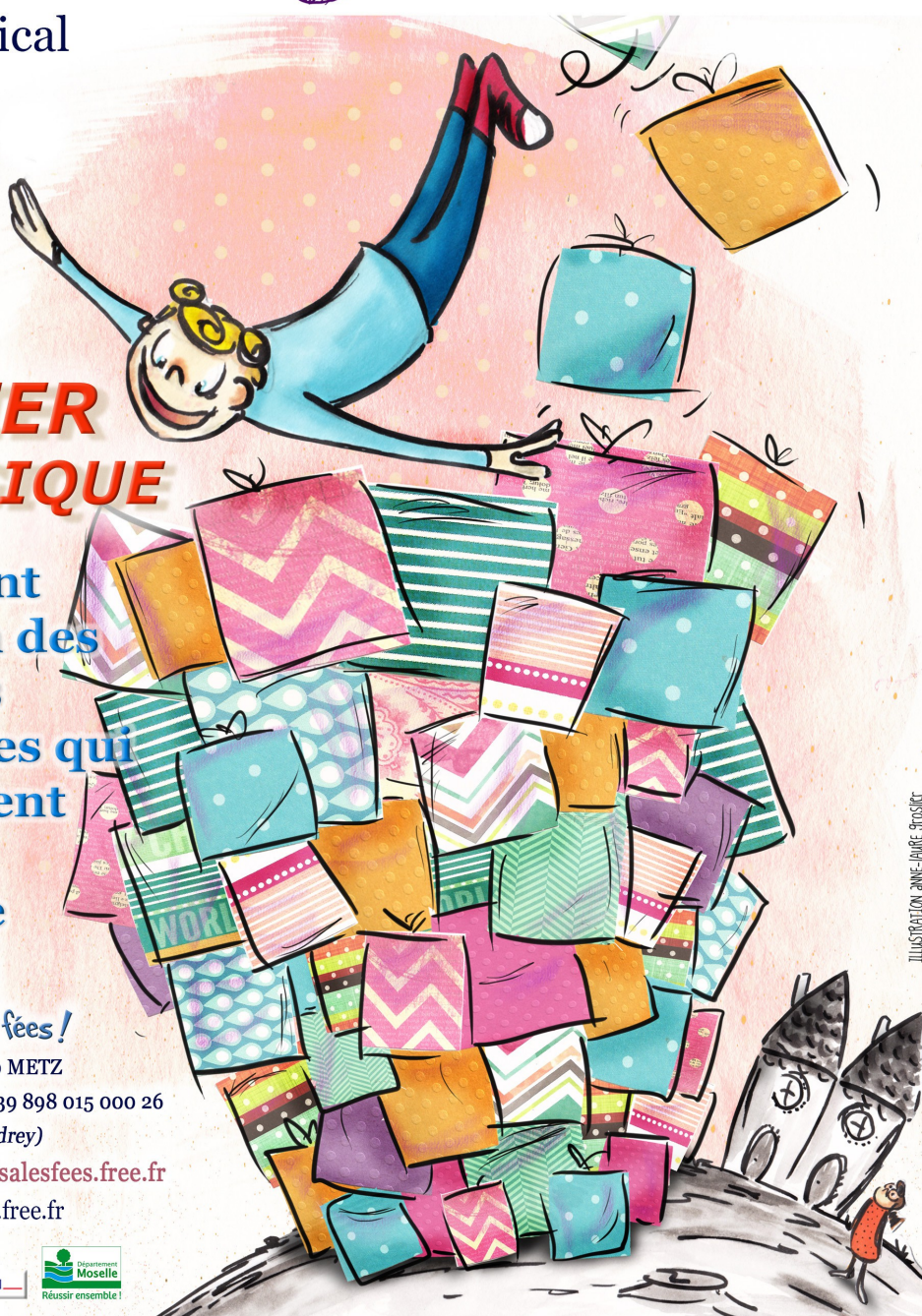
ILLUSTRATION ANNE-PAULE STOSIC